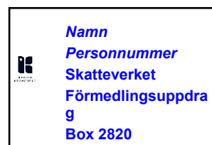
Inre kuvert, REK (1)