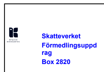
Yttre kuvert (2)