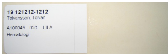
Streckkodsetiketten klistras lodrätt med rätt sida uppåt, direkt under rörets kork.