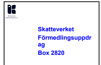
Yttre kuvert, REK (2)